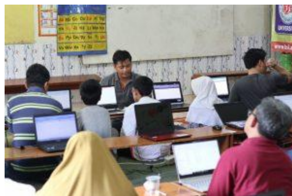
Gambar 2. Tutor menyampaikan materi

Pada gambar 1 merupakan pembukaan yang berisi tentang alur kegiatan dan akan dipraktikkan