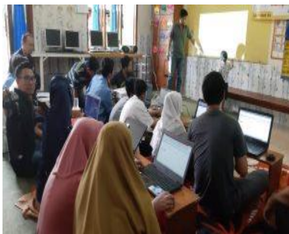
Gambar 4. Ketika peserta menjawab pertanyaan tutor

Pada gambar 3 terlihat terjadi ketika ada peserta yang mengajukan pertanyaan. Selama pelatihan, para peserta / anak-anak sangat antusias mengikuti jalannya pelatihan karena dukungan sarana dan prasarana memadai, sehingga mereka bisa sambil mempraktikkan langsung sesuai materi yang disajikan. Dengan begitu, mereka merasa lebih bisa mengeksplorasi dengan baik dan lebih mampu memahami detail materi yang diajarkan. Hal ini dapat dilihat pada gambar 4 dimana peserta / anak-anak beranikan diri kedepan untuk menjawab pertanyaan tutor.