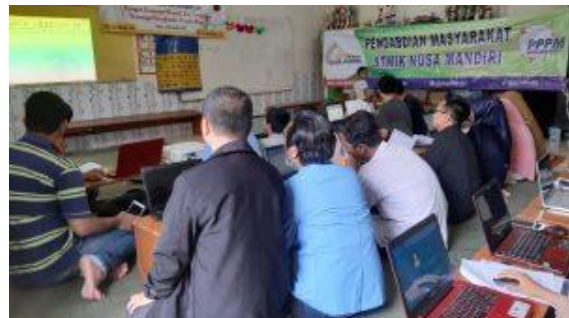
Gambar 1. Pembukaan Materi

Pelatihan dimulai dengan pembukaan dan dilanjutkan dengan materi penyampaian oleh tutor dan tidak lupa tiap peserta diberikan materi yang sama dengan tutor.