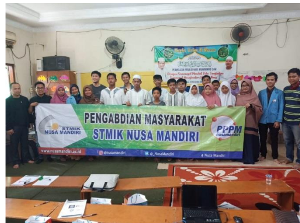
Gambar 5. Sesi foto

Pada sesi akhir, dilakukan foto bersama seperti yang terlihat pada gambar 5.