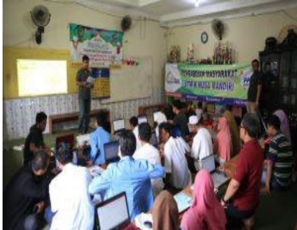
Gambar 3. Peserta mengajukan pertanyaan

Pada gambar 2 tutor menyampaikan materi tentang definisi, fungsi dan tujuan tentang materi, peserta juga mendapat modul mengenai apa yang sedang dipelajari serta bersama mempraktikkan materi yang diterangkan.