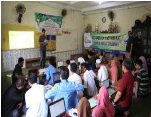
Gambar 3. Peserta mengajukan pertanyaan

Pada gambar 2 tutor menyampaikan materi tentang definisi, fungsi dan tujuan tentang materi, peserta juga mendapat modul mengenai apa yang sedang dipelajari serta bersama mempraktikkan materi yang diterangkan.