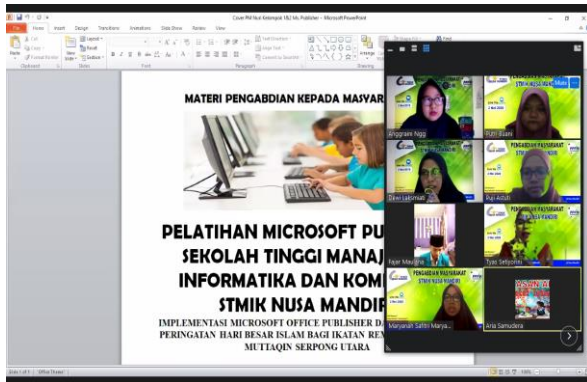
Gambar 3. Tutor menyampaikan fitur tambahan

Pada gambar 3 tutor menyampaikan fitur tambahan guna mengoptimalkan penggunaan Microsoft Publisher. Selama pelatihan, para peserta sangat antusias mengikuti jalannya pelatihan karena dukungan sarana dan prasarana memadai, sehingga mereka bisa sambil mempraktikkan langsung sesuai materi yang disajikan. Dengan begitu, mereka merasa lebih bisa mengeksplorasi dengan baik dan lebih mampu memahami detail materi yang diajarkan. Hal ini dapat dilihat pada gambar 4.