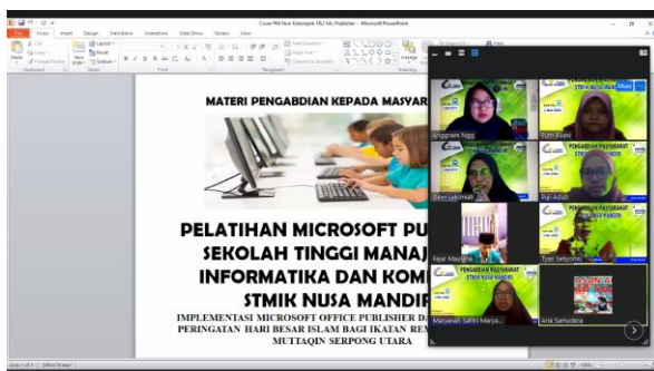
Gambar 4. Ketika peserta bertanya

Pada gambar 3 tutor menyampaikan fitur tambahan guna mengoptimalkan penggunaan Microsoft Publisher. Selama pelatihan, para peserta sangat antusias mengikuti jalannya pelatihan karena dukungan sarana dan prasarana memadai, sehingga mereka bisa sambil mempraktikkan langsung sesuai materi yang disajikan. Dengan begitu, mereka merasa lebih bisa mengeksplorasi dengan baik dan lebih mampu memahami detail materi yang diajarkan. Hal ini dapat dilihat pada gambar 4.