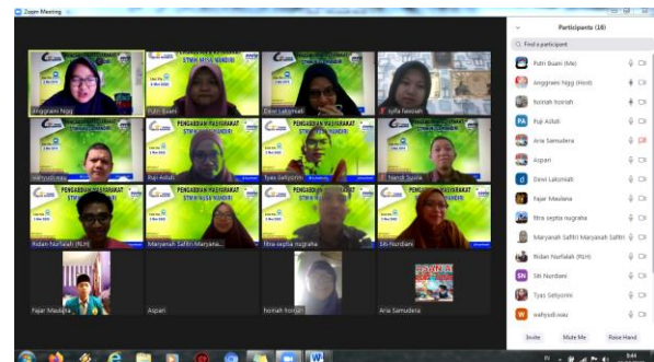
Gambar 5. Sesi foto

Pada sesi akhir, dilakukan foto bersama seperti yang terlihat pada gambar 5.