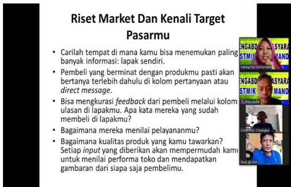
Gambar 3. Peserta mengajukan pertanyaan

Pada gambar 2 tutor menyampaikan materi pendahuluan workshop pemanfaatan marketplace dalam menunjang pemasaran produk pada komunitas mersi fans club.