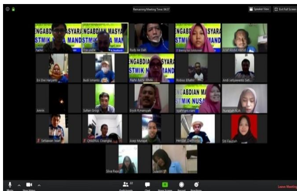
Gambar 4. Sesi foto

Pada sesi akhir, dilakukan foto bersama seperti yang terlihat pada gambar 4.