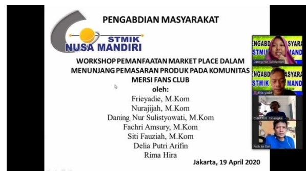
Gambar 1. Pembukaan Materi

Kegiatan pelatihan dimulai dengan pembukaan dan dilanjut dengan materi penyampaian oleh tutor dan tidak lupa tiap peserta diberikan materi yang sama dengan tutor.