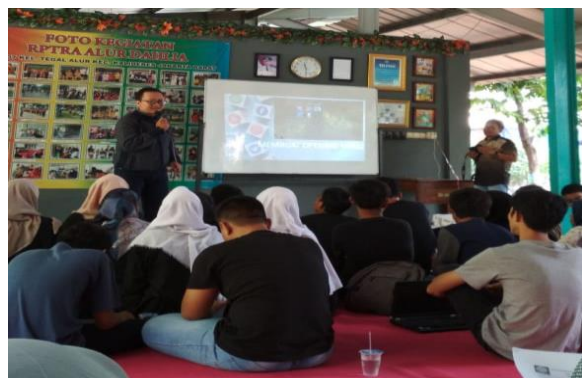
Gambar 5. Antusiasme peserta dalam mendengarkan tutor

Dalam pelaksanaan berjalan dengan baik yang terlihat seperti gambar 4 dimana peserta begitu antusias dalam memperhatikan tutor dalam menyampaikan materi.