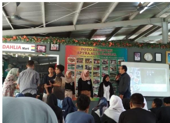
Gambar 3. Diskusi interaktif dengan peserta

Kemudian peserta juga diajak langsung untuk partisipasi dan melakukan diskusi dengan tutor perihal materi, seperti terlihat pada gambar 3.