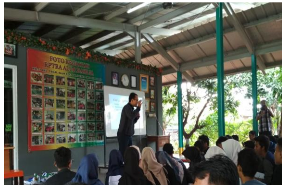
Gambar 2. Tutor memberikan materi kepada peserta

Pelaksanaan dimulai dengan tutor melakukan pembukaan dan memberikan materi kepada peserta seperti terlihat pada gambar 2.