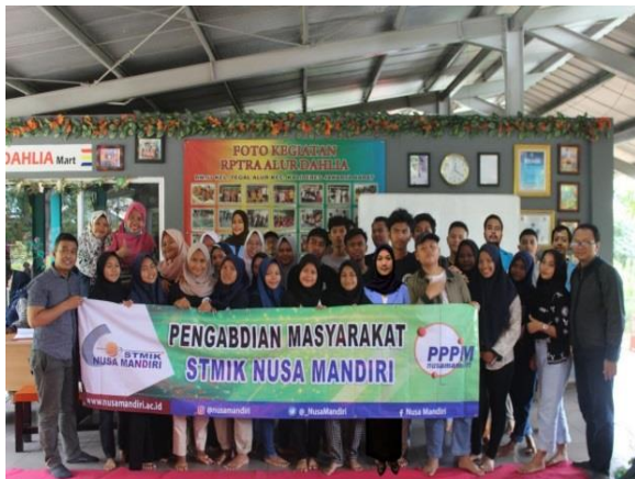
Gambar 6. Foto bersama dengan peserta

Setelah acara berlangsung dilakukan juga foto bersama sebagai dokumentasi akhir dan acara pun berjalan dengan baik dan lancar.