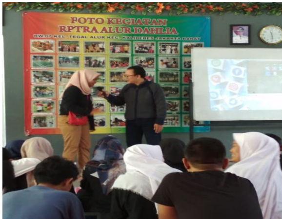
Gambar 5. Tanya jawab dengan peserta

Kemudian dalam pelaksanaan juga peserta dipersilahkan untuk bertanya dan diskusi, seperti terlihat pada gambar 5 dimana ada salah satu peserta bertanya kepada tutor perihal materi.