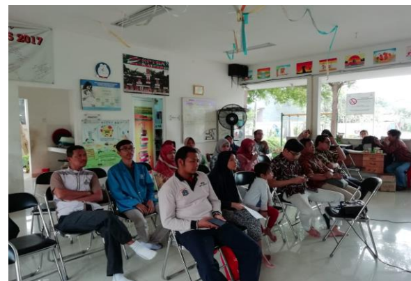
Gambar 3. Suasana Kegiatan Pelaksanaan

Pada gambar 2 merupakan pembukaan kegiatan yang disampaikan oleh tutor menyampaikan tentang daftar pembahasan pengenalan dasar fisik perangkat keras selama acara berlangsung.