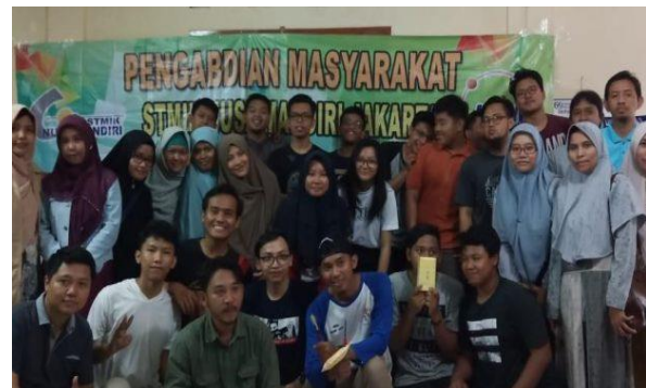
Gambar 9. Foto bersama dengan peserta

diskusi dan pertanyaan yang berkaitan dengan isi materi pembelajaran. Setelah akhir kegiatan acara ditutup dengan doa kemudian dilanjutkan dengan dokumentasi bersama antara panitia juga peserta seperti terlihat pada gambar 9.