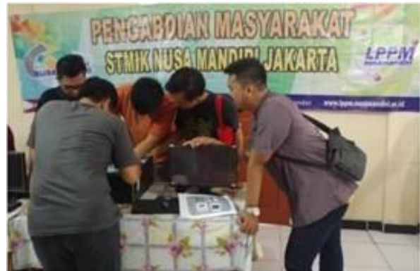
Gambar 6. Games dari Tutor

mengerti. Dalam gambar 6 juga terlihat dimana tutor memberikan games yang mana peserta menjawab dengan menunjuk perangkat keras tersebut serta menjelaskan fungsi dari perangkat keras tersebut.