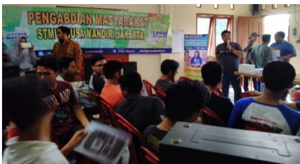
Gambar 1. Sambutan Ketua Katana22

Melalui program pengabdian masyarakat ini dapat menambah pengetahuan perangkat komputer, mulai dari bentuk fisik serta fungsinya dan memotivasi para peserta yaitu pemuda Karang Taruna 22 untuk dapat merakit perangkat komputer secara mandiri. Kegiatan ini didukung penuh oleh mitra Karang Taruna RW 022 (katana22) kota Bekasi, seperti terlihat di hasil dokumentasi pada gambar 1 dimana perwakilan katana22 memberikan sambutan dan menyampaikan bahwa kegiatan ini bermanfaat dan semoga peserta mampu mengembangkan apa yang didapat dari pelatihan ini.