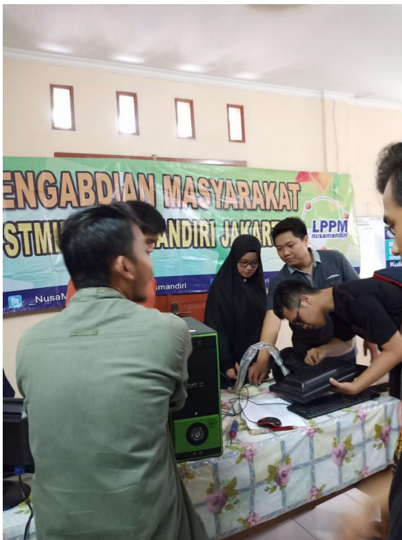
Gambar 5. Sesi Rakit Perangkat Keras

Kemudian hari kedua merupakan pelatihan perangkat keras, seperti pada gambar 5 yang mana tutor memberikan arahan lalu diikuti dengan praktik dari peserta secara langsung.