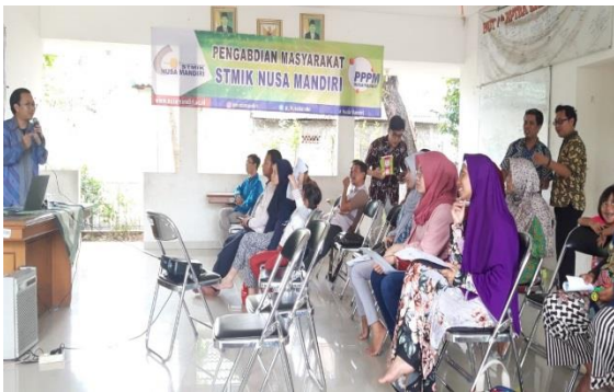
Gambar 4. Penyampaian Materi oleh Tutor

Kemudian hari kedua merupakan pelatihan perangkat keras, seperti pada gambar 5 yang mana tutor memberikan arahan lalu diikuti dengan praktik dari peserta secara langsung.