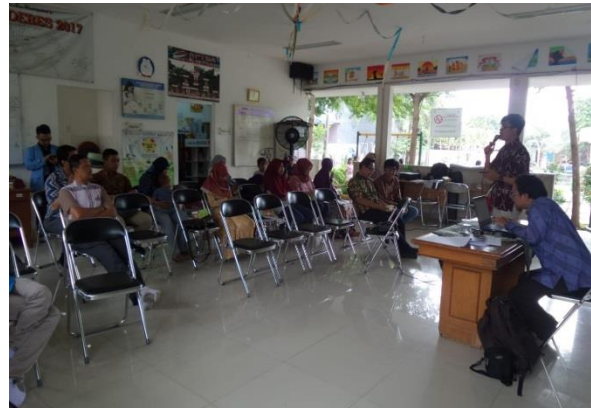
Gambar 2. Pembukaan Kegiatan oleh Tutor

Sesi pelaksanaan dibagi menjadi 2 hari dimana hari pertama membahas pengenalan bentuk fisik, fungsi dan cara penggunaan perangkat keras kemudian hari kedua membahas bagaimana cara merakit komputer dengan terstruktur.