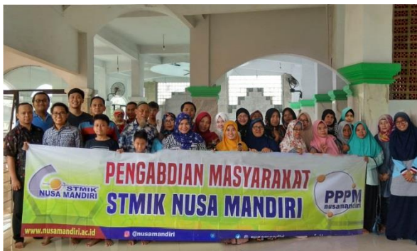
Gambar 2. Dokumentasi bersama

Untuk para peserta yang belum paham, responnya cenderung pasif walaupun begitu peserta tetap memperhatikan materi yang diberikan instruktur dengan lebih seksama sehingga dapat mengikuti dengan baik. Respon yang mereka berikan sangat sedikit saat awal pelatihan. Namun di pertengahan pelatihan ketika instruktur memperhatikan satu persatu atau asisten pelatihan ini mendekat untuk memberikan bantuan dan menanyakan kesulitan mereka secara personal, mereka lebih responsif untuk mendapatkan bantuan. Pada sesi akhir, dilakukan foto bersama seperti yang terlihat pada gambar 2.