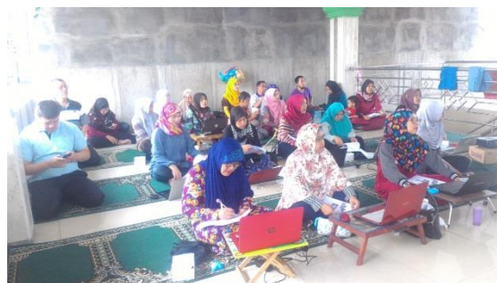
Gambar 1. Pemateri menyampaikan teori

Tiga orang instruktur secara bergantian sesuai materinya, memandu pemberian teori pelatihan di depan. Untuk efektifitas pelayanan, pelatihan dibantu oleh 2 (dua) orang asisten mahasiswa yang merupakan asisten Lab, yang akan membantu peserta yang mengalami kesulitan. Pemberian teori dilakukan bersamaan dengan pemberian latihan sehingga para peserta dapat langsung mempraktikkannya. Hal ini dapat dilihat dari dokumentasi [9] kegiatan seperti gambar 1.