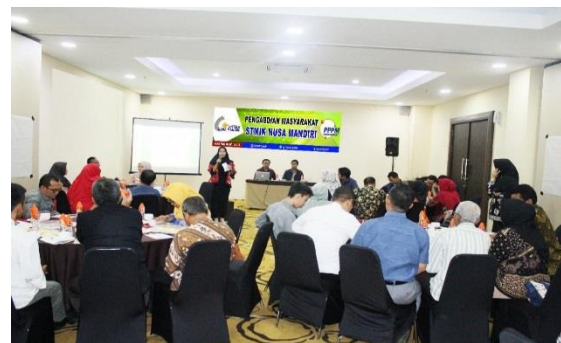
Gambar 3. Diskusi dengan peserta

Selama kegiatan berlangsung peserta bebas untuk bertanya mengenai hal bahasan dengan memberikan terlebih dahulu instruksi, seperti terlihat dalam gambar 2 yang mana ada salah satu peserta yang bertanya terkait dengan pembahasan.