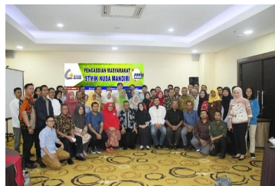
Gambar 4. Dokumentasi bersama

Kemudian terlihat pada gambar 3 yang mana kegiatan ini juga merupakan tempat diskusi tentang pemanfaatan aplikasi bagi masyarakat sekitar juga sehingga diharapkan apa yang dilakukan yang menggunakan internet dapat digunakan dengan bijak dan dapat bermanfaat dengan cara yang baik.