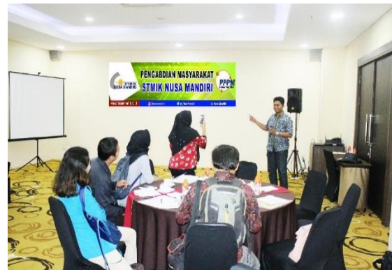
Gambar 2. Tanya Jawab dengan peserta

Sebagai dosen kita pun bertanggung jawab untuk memberikan pelatihan dan penyuluhan dalam rangka melaksanakan tri dharma perguruan tinggi, yang salah satunya dengan melakukan kegiatan pengabdian masyarakat.