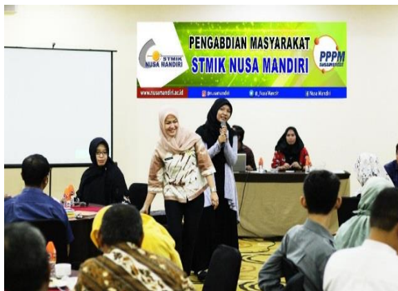
Gambar 1. Pembukaan materi

Dalam Pengabdian Masyarakat ini Hasil yang didapat adalah kemampuan peserta Pengabdian Masyarakat memahami pengaruh televisi sebagai akses informasi bagi Kelompok Swadaya Masyarakat (KSM) Kota Bekasi. Dilihat dari antusias dalam kegiatan ini, maka terlihat respon yang baik. Berikut merupakan dokumentasi mengenai pelaksanaan selama kegiatan berlangsung[12]: