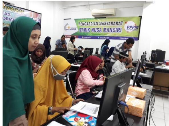
Gambar 2. Tim memberikan arahan

Seperti terlihat pada gambar 2 yang mana tim memandu dan mengarahkan peserta.