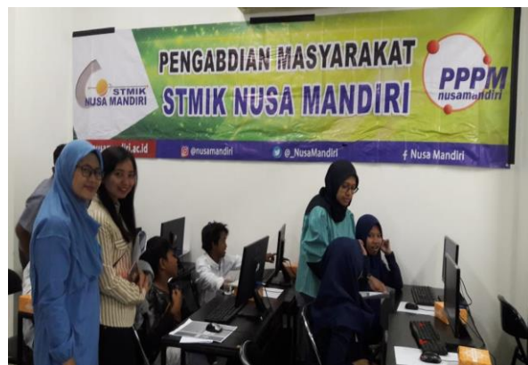
Gambar 3. Tim membantu peserta yang kesulitan

Dalam pelaksanaan berlangsung tutor juga mempraktikkan bagaimana cara menggunakan Adobe Photoshop dengan penyampaian sederhana dan pelan sehingga peserta mampu mengikuti arahan dengan baik terlebih lagi ada tim yang siap membantu apabila ada peserta yang mengalami kesulitan seperti terlihat pada gambar 3.