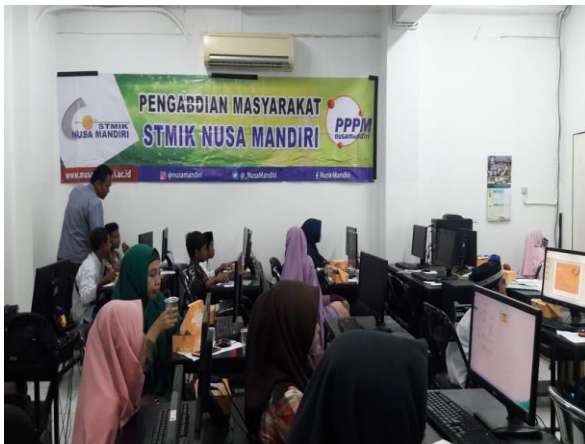
Gambar 4. Sesi tanya jawab

Dilihat dari aktivitas peserta, maka terlihat respon para peserta sangat tinggi. Banyak di antara mereka yang bertanya dan kemudian terlibat dalam diskusi, dan kemudian menindak-lanjutnya dengan praktek materi yang mereka pertanyakan. Kegiatanpun berjalan dengan tenang dan tertib seperti terlihat pada gambar 5.