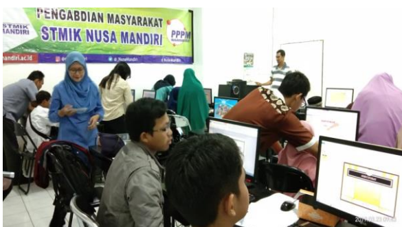
Gambar 6. Tutor menyampaikan materi

Setiap melakukan penjelasan, tutor juga memberikan arahan secara sederhana dan mempraktikkan bersama untuk penggunaan Adobe Photoshop ini seperti terlihat pada gambar 6.