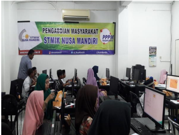
Gambar 4. Sesi tanya jawab

Dilihat dari aktivitas peserta, maka terlihat respon para peserta sangat tinggi. Banyak di antara mereka yang bertanya dan kemudian terlibat dalam diskusi, dan kemudian menindak-lanjutnya dengan praktek materi yang mereka pertanyakan. Kegiatanpun berjalan dengan tenang dan tertib seperti terlihat pada gambar 5.