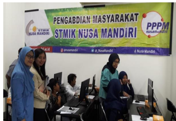
Gambar 3. Tim membantu peserta yang kesulitan

Dalam pelaksanaan berlangsung tutor juga mempraktikkan bagaimana cara menggunakan Adobe Photoshop dengan penyampaian sederhana dan pelan sehingga peserta mampu mengikuti arahan dengan baik terlebih lagi ada tim yang siap membantu apabila ada peserta yang mengalami kesulitan seperti terlihat pada gambar 3.