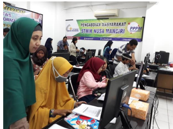
Gambar 2. Tim memberikan arahan

Seperti terlihat pada gambar 2 yang mana tim memandu dan mengarahkan peserta.