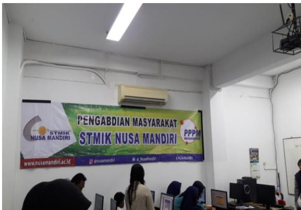
Gambar 5. Kegiatan berjalan tertib

Dilihat dari aktivitas peserta, maka terlihat respon para peserta sangat tinggi. Banyak di antara mereka yang bertanya dan kemudian terlibat dalam diskusi, dan kemudian menindak-lanjutnya dengan praktek materi yang mereka pertanyakan. Kegiatanpun berjalan dengan tenang dan tertib seperti terlihat pada gambar 5.