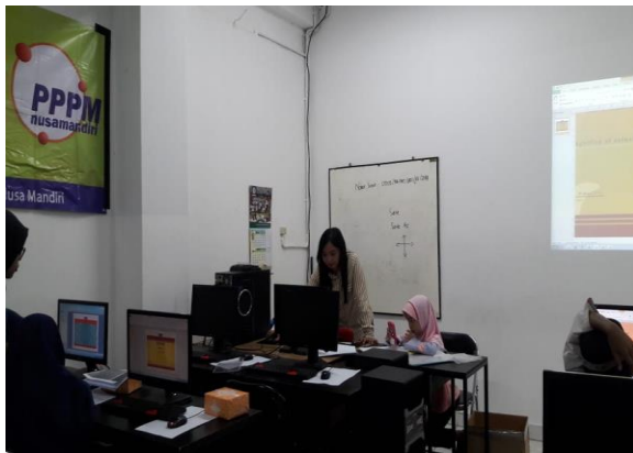
Gambar 1. Pembukaan Kegiatan

Kegiatan dimulai dengan pembukaan dan sambutan dari ketua Yayasan Media Amal Islami (MAI) kemudian dilanjut ke materi dimana peserta diarahkan untuk membuka pembahasan pertama mengenai Adobe Photoshop, tutor menjelaskan apa itu photoshop, fungsi dan kelebihannya serta apa saja peluang yang bisa didapat jika mempunyai keahlian menggunakan aplikasi ini. Seperti terlihat pada gambar 1.