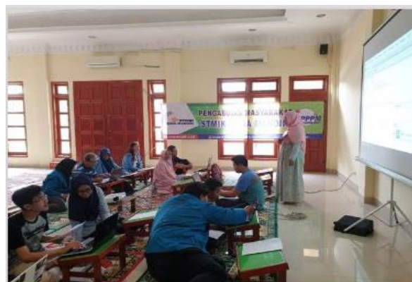
Gambar 4. Penyampaian Lanjutan Pelatihan

Pada gambar 3 terlihat pemateri menyampaikan materi dasar terlebih dahulu mengenai dasar programming dan instalasi perangkat lunak sesuai kebutuhan.