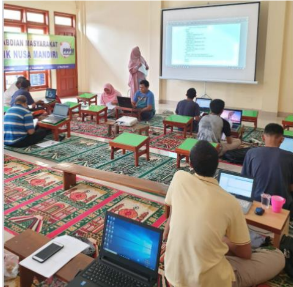
Gambar 5. Lanjutan Materi

Pada gambar 4 merupakan hari kedua yang mana pemateri mulai memberikan penjelasan tentang membuat program terstruktur, program yang disampaikan berupa materi php [6] dan juga pengenalan Content-Management-System Wordpress [7] dengan penyampaian sederhana.