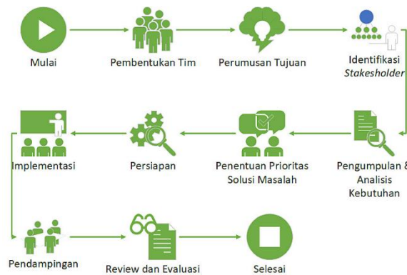
Gambar 2. Metode Penelitian

Gambar 2, metode yang digunakan dalam Pengabdian Kepada Masyarakat kali ini adalah dengan menggunakan metode sebagai berikut [5]: