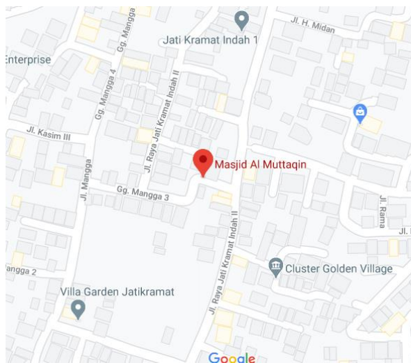
Gambar 1 Peta Lokasi Objek Pengabdian Masyarakat DKM Masjid Al-Muttaqin

Dengan melakukan pengabdian kepada masyarakat salah satunya pada Dewan Kemakmuran Masjid (DKM) [3] Al-Muttaqin Bekasi, dimana Pengurus DKM Masjid Al-Muttaqin tersebut membutuhkan ilmu untuk mendukung kegiatan kerja mereka sehari-hari terutama dalam pembuatan web DKM Masjid Al-Muttaqin. Lokasi tempat pengabdian pada Masjid Al-Muttaqin beralamat di Jalan Jatikramat Indah 2, Gang Mangga 3, Jatikramat Jatiasih Kota Bekasi-Jawa Barat 17421, Gambar 1 peta lokasi objek pengabdian masyarakat.