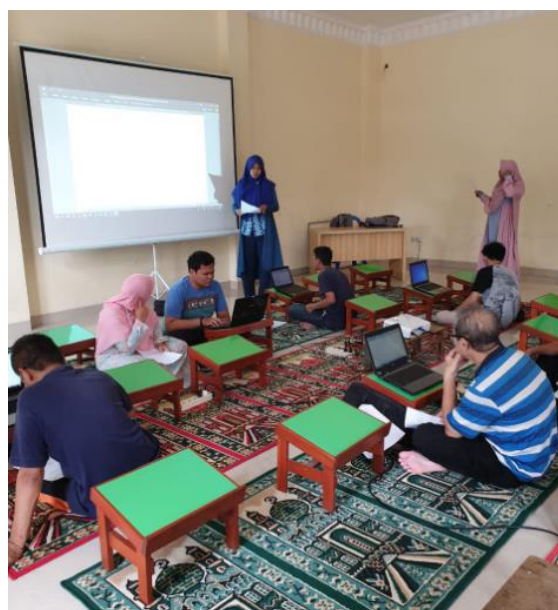
Gambar 3. Pembukaan Materi

Kegiatan berlangsung selama 2 hari terdiri dari instalasi perangkat lunak yang dibutuhkan dan latihan dasar untuk mengenal dasar programming terlebih dahulu.