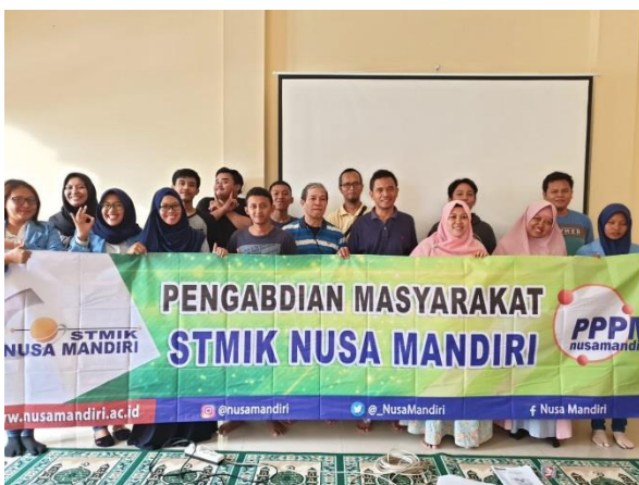
Gambar 6. Foto Bersama

Dalam menyampaikan materi peserta dipersilahkan bertanya dan diskusi mengenai materi yang dibahas, materi yang disampaikan sudah terdokumentasi dalam modul ajar yang dibagikan kepada peserta, sehingga peserta juga dapat mengerti dan mempelajarinya di rumah masing-masing, seperti terlihat pada gambar 5.