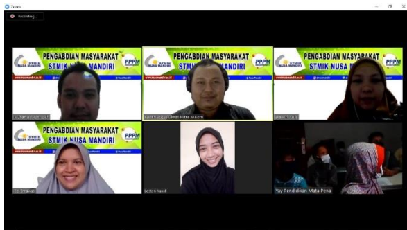
Gambar 5. Foto Bersama Sesi Akhir

Materi yang disampaikan disampaikan dengan Bahasa sederhana dan jelas sehingga peserta mampu memahami sepenuhnya. Panitia berusaha menyiapkan suara dan internet sehingga kegiatan berjalan baik dengan suara yang jelas dan kecepatan internet yang stabil. Peserta ditempatkan pada ruangan yang sama namun dengan menjalankan protokoler kesehatan yang berlaku seperti terlihat pada gambar 4 yang mana peserta sedang memperhatikan apa yang disampaikan pemateri dengan tenang.