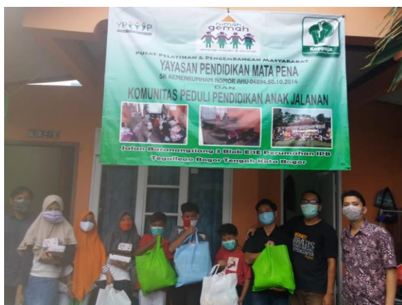
Gambar 6. Foto Bersama

Penyampaian materi juga dibarengi dengan sebuah games sehingga peserta dapat berinteraksi maupun tanya jawab dengan pemateri dengan menyenangkan dan penyampaian materi yang ringan sehingga peserta mampu menangkap apa yang disampaikan oleh pemateri. Kemudian setelah kegiatan berakhir, dilakukan sesi foto bersama seperti terlihat pada gambar 5 dan diakhiri dengan membagikan kuesioner guna evaluasi kegiatan.