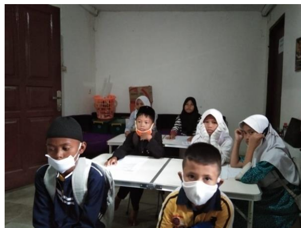
Gambar 4. Peserta Memperhatikan Materi

Pada gambar 3 terlihat kegiatan berjalan dengan baik, kemudian peserta juga dipersilahkan untuk berinteraksi langsung dengan pemateri sehingga apa yang disampaikan dapat ditangkap dengan baik dan mudah difahami.