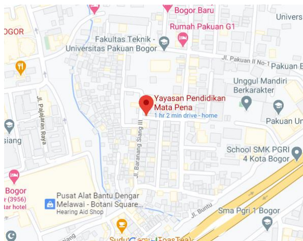
Gambar 1. Lokasi Yayasan Pendidikan Mata Pena

Yayasan pendidikan mata pena yang menaungi Komunitas Peduli Pendidikan Anak Jalanan (KOPPAJA) kurang lebih ada 40 anggota ini sangat antusias dalam pembelajaran maupun dalam bidang usaha. Gambar 1 peta lokasi Yayasan Pendidikan Mata Pena yang beralamat di Jl. Baranangsiang 3 Blok E No. 1E RT 03 RW 08 Perumahan IPB, Kelurahan Tegallega Kecamatan Bogor Tengah Kota Bogor.