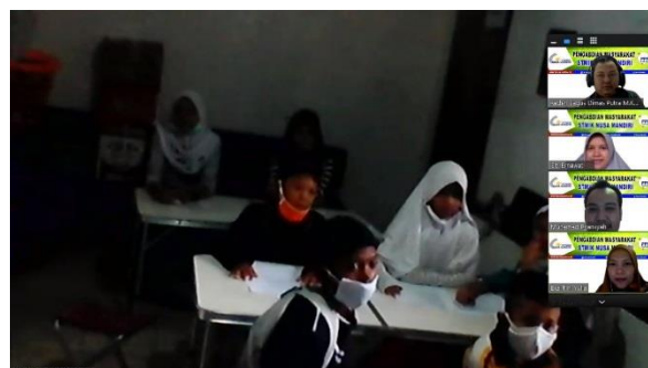
Gambar 3. Tutor Menyampaikan Materi

Pada gambar 2 merupakan bagian pertama materi yang disampaikan yaitu pengenalan system operasi windows namun sebelum itu dilakukan sambutan dahulu dari ketua yayasan yang kesimpulannya mendukung kegiatan ini dari awal sampai akhir.