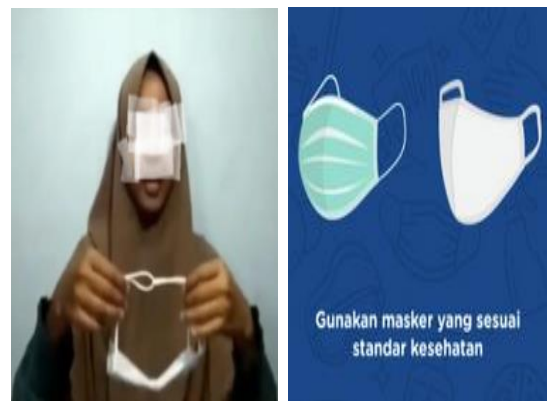
Gambar 6. Jenis masker kesehatan