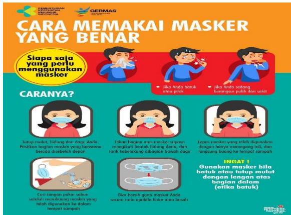
Gambar 2. e-poster cara Pemakaian masker