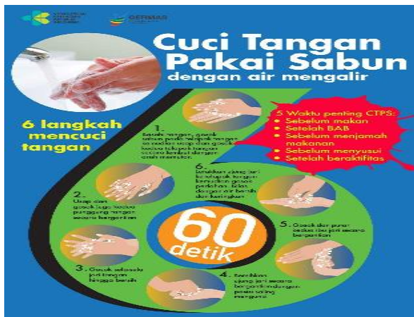
Gambar 4. e-Poster Cara Cuci Tangan