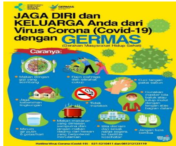
Gambar 5. e-Imunitas tubuh