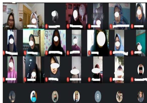
Gambar 7. Program Edukasi kesehatan via online