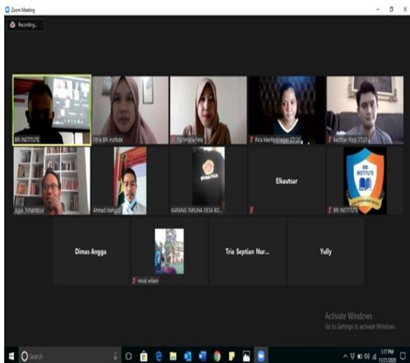
Gambar 7. Absensi para peserta yang di lakukan di zoom meeting

Selama pelatihan, para peserta cukup antusias mengikuti. Hal ini disebabkan karena sarana dan prasarana yang cukup lengkap di sediakan. Kesempatan untuk bertanya juga di berikan sehingga mereka merasa dapat mengeksplorasi dengan baik dan lebih mampu secara rinci karena contoh desain produk di berikan secara langsung. Hal ini dijelaskan pada Gambar 6