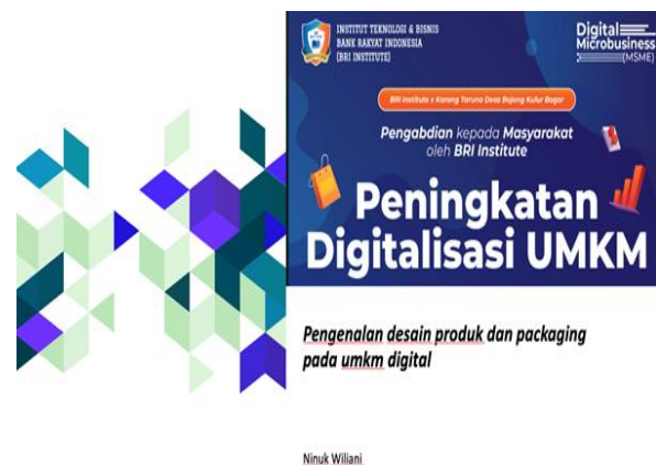
Gambar 4. Cover Slide Materi Pelatihan

Pada Gambar 4 diperlihatkan cover untuk materi pelatihan yang mengambil tema Peningkatan Digitalisasi UMKM. Materi ini di buat semenarik mungkin agar isi dari materi dapat mudah dimengerti oleh peserta.