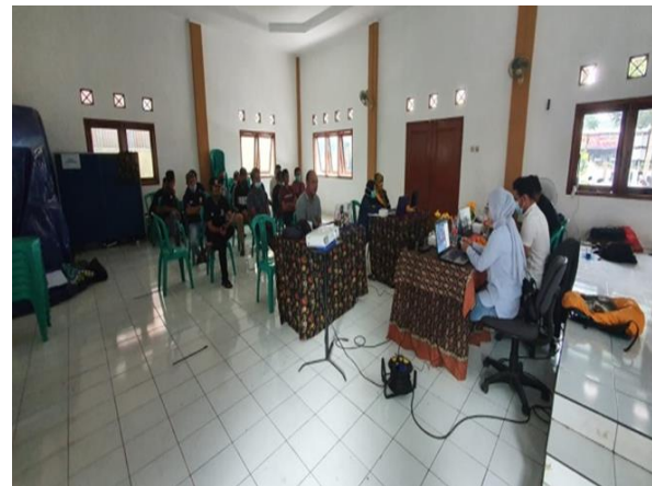
Gambar 8. Antusias dari para peserta

Pada Gambar 7 diperlihatkan kegiatan yang di langungkan secara daring, karena antusias dari beberapa UMKM yang daerahnya tidak memungkinkan untuk datang ke lokasi dan mengikuti kegiatan secara offline