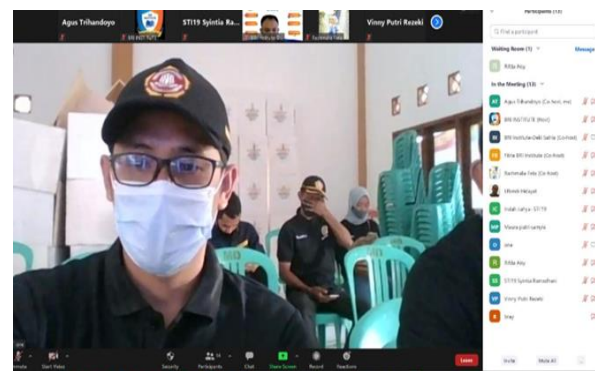
Gambar 5. Screenshoot zoom meeting

Pada Gambar 4 diperlihatkan cover untuk materi pelatihan yang mengambil tema Peningkatan Digitalisasi UMKM. Materi ini di buat semenarik mungkin agar isi dari materi dapat mudah dimengerti oleh peserta.