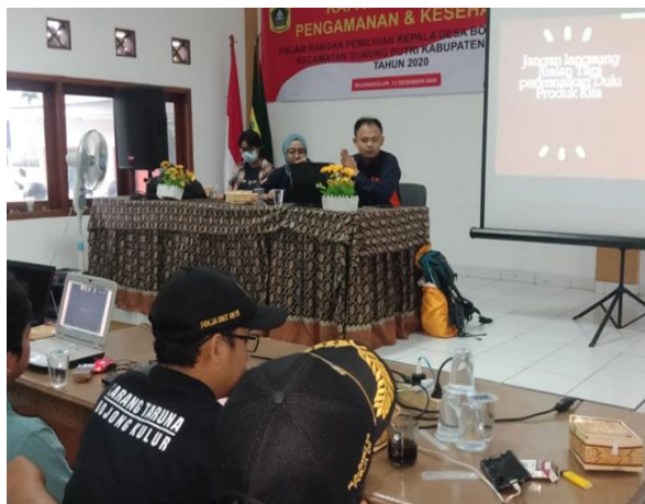
Gambar 3. Pelaksanaan secara offline

Program pelatihan ini menggunakan dua skema, skema offline dan Online. Untuk Offline ada beberapa pelaku UMKM yang datang di kelurahan bojong kulur untuk mendengar secara langsung. Sedangkan instruktur memberikan secara online dengan melakukan zoom meeting. Dengan Instruktur memberikan teori diharapkan peserta mampu memahami modul. Sedangkan di tempat Kelurahan disediakan seperangkat LCD proyektor untuk mempermudah dalam penyampaian materi. Sehingga peserta lebih leluasa melihat materi yang disampaikan,