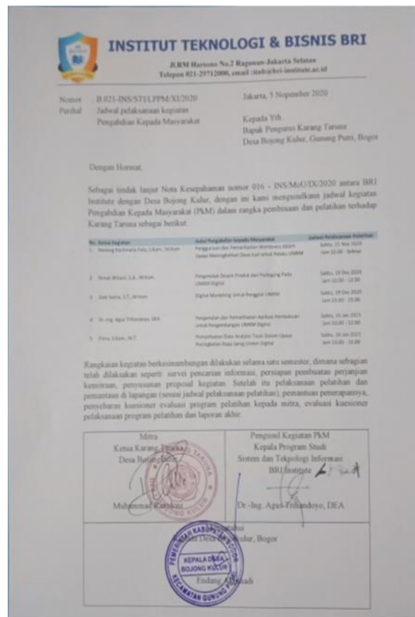
Gambar 9. Surat jadwal kegiatan pengabdian kepada masyarakat

Pada Gambar 8 terlihat situasi kegiatan yang di lakukan secara offline. Walaupun dilakukna secara offline, kegiatan ini di lakukan mengikuti protocol Kesehatan yang berlaku