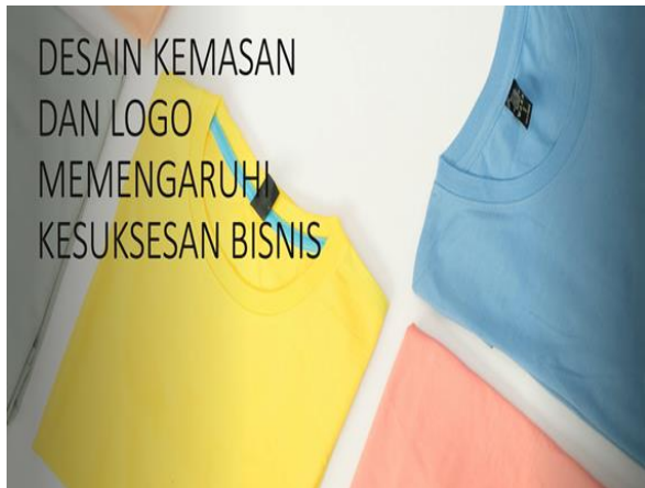
Gambar 6. Pemberian materi mengenai desain kemasan logi

Selama pelatihan, para peserta cukup antusias mengikuti. Hal ini disebabkan karena sarana dan prasarana yang cukup lengkap di sediakan. Kesempatan untuk bertanya juga di berikan sehingga mereka merasa dapat mengeksplorasi dengan baik dan lebih mampu secara rinci karena contoh desain produk di berikan secara langsung. Hal ini dijelaskan pada Gambar 6