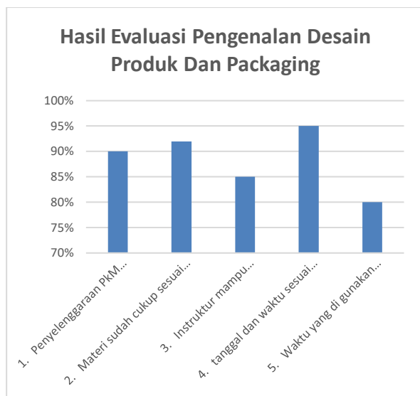
Gambar 9. Grafik Korespondensi

Pada Gambar 9 dijelaskan dengan menggunakan diagram batang yang memperlihatkan berapa persen tanggapan dari peserta mengenai keadaan dan materi yang disampaikan oleh pemateri.