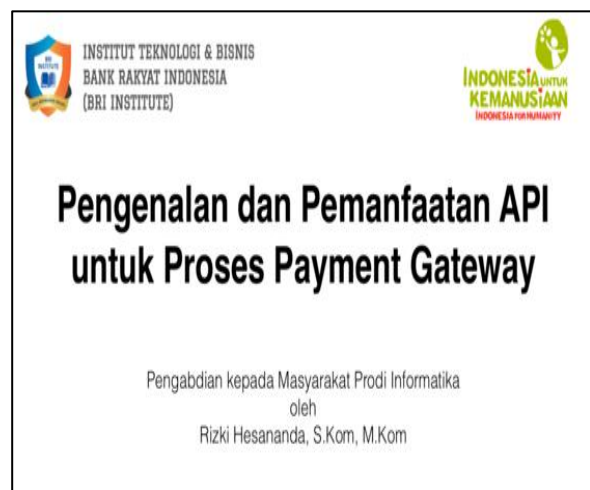
Gambar 2. Persiapan materi lokakarya oleh dosen