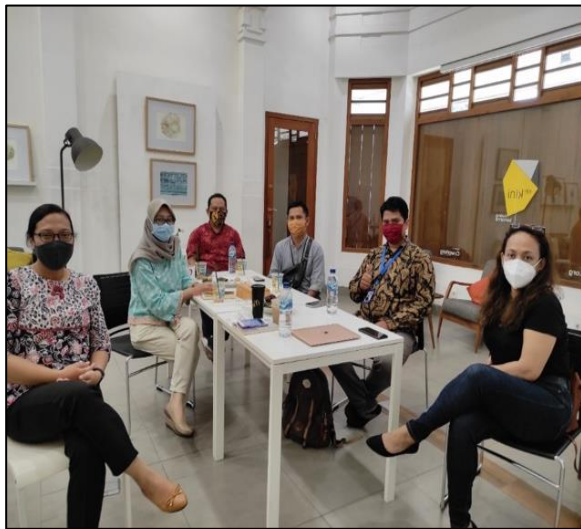
Gambar 1. Diskusi untuk tahap analisis lingkungan

Analisis lingkungan dilakukan melalui rapat luring di kantor calon peserta lokakarya dengan memenuhi protokol kesehatan Pandemi Covid-19. Tim dosen mengadakan diskusi dengan Tim Yayasan Indonesia Untuk Kemanusiaan untuk mengumpulkan informasi awal[7]. Informasi yang didapat adalah: