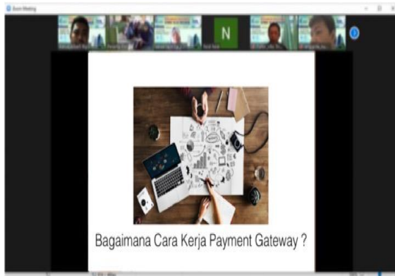
Gambar 4. Pemaparan materi lokakarya oleh narasumber