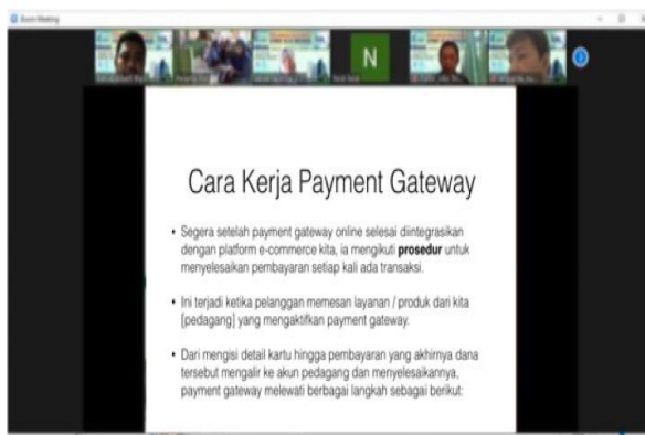
Gambar 5. Pemaparan materi lokakarya oleh narasumber

Pemaparan materi dilakukan oleh dosen sebagai narasumber dan dipandu oleh mahasiswa sebagai moderator. Pemaparan materi berlangsung selama 60 Menit. Setelah peserta diberi pemahaman mengenai payment gateway , kegiatan dilanjutkan dengan praktek dengan durasi 60 menit oleh peserta lokakarya.