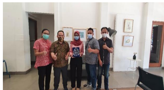
Gambar 8. Penyerahan Plakat

Sesi tanya jawab dan diskusi dilakukan selama 30 menit. Narasumber menjawab pertanyaan-pertanyaan dari peserta. Bentuk pertanyaan meliputi hal teoritis dan praktikal mengenai cara kerja, arsitektur sistem, kelebihan dan kekurangan, dan sistem keamanan payment gateway [8]. Sesi terakhir dalam pelaksanaan kegiatan ini adalah pentutupan kegiatan yang ditandai dengan penyerahan plakat kepada direktur eksekutif Yayasan Indonesia untuk Kemanusiaan dari Program Studi Informatika Institute dan Teknologi BRI.