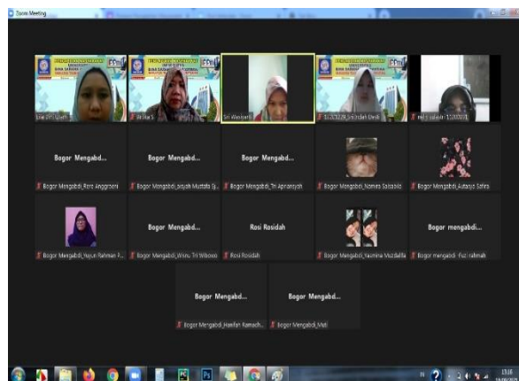
Gambar 1. Pelaksanaan Pelatihan

ucapan terima kasih dari pengurus komunitas Bogor mengabdikan serta penyerahan seperangkat printer untuk menunjang kinerja di sekretariat