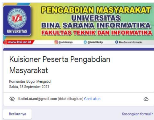
Gambar 3. Kuisisioner [Bagian 1]

Gambar diatas merupakan tampilan awal kuisisioner yang akan dishare linknya ke peserta setelah pelaksanaan pelatihan.