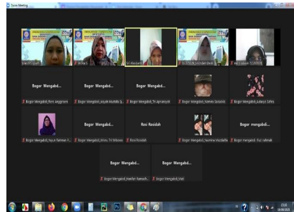
Gambar 1. Pelaksanaan Pelatihan

ucapan terima kasih dari pengurus komunitas Bogor mengabdikan serta penyerahan seperangkat printer untuk menunjang kinerja di sekretariat