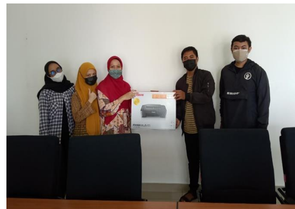
Gambar 2. Penyerahan Perangkat printer

Kondisi pandemi menyebabkan pelaksanaan masih dilaksanakan secara daring seperti pada gambar 1, dan gambar 2 adalah pelaksanaan pelatihan dengan aplikasi zoom meeting