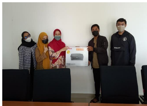
Gambar 2. Penyerahan Perangkat printer

Kondisi pandemi menyebabkan pelaksanaan masih dilaksanakan secara daring seperti pada gambar 1, dan gambar 2 adalah pelaksanaan pelatihan dengan aplikasi zoom meeting