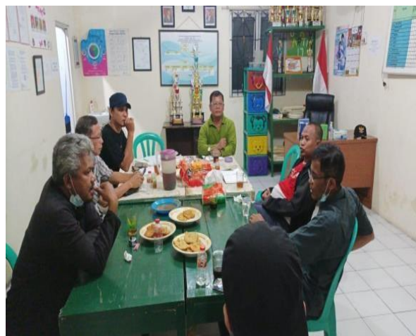
Gambar 2. Observasi dan wawancara Ketua RW

RW 017 Regensi dalam pembahasan permasalahan serta solusi yang diberikan oleh Kelompok Pengabdian Masyarakat dapat menjadi sarana atau pedoman paham akan pentingnya fungsi teknologi informasi. Kegiatan Pengabdian Masyarakat ini berlangsung di kantor RW 017 Bekasi Timur Regensi yang beralamat di Blok J Jl.Jalak Bali 3 RW 017 Bekasi Timur Regensi Kelurahan Cimuning Kecamatan Mustika Jaya Kota Bekasi 17155.