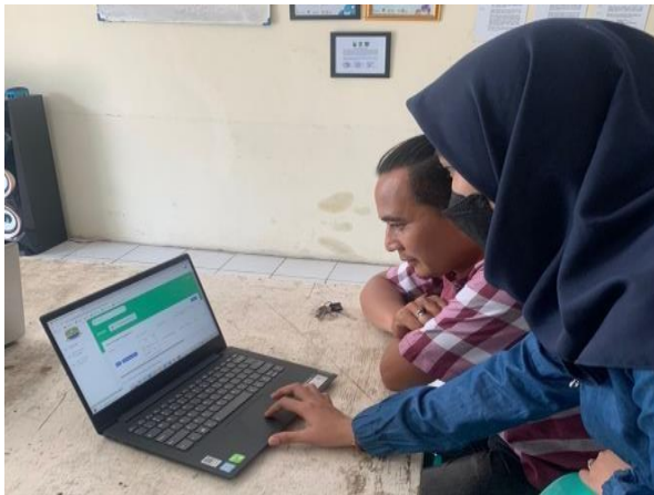
Gambar 4. Mengetahui Fitur-Fitur Program

Ketua RW 017 Bekasi Timur Regensi dan anggota pengurus.