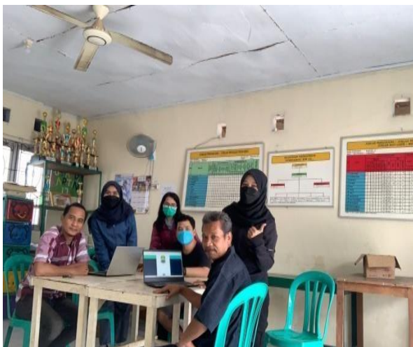
Gambar 5. Diakhiri Kegiatan pelatihan dan seminar

Tahap Pengenalan Fitur – Fitur yang ada didalam Program Pengelolaan dana Kas kepada pengurus RW 017 Bekasi Timur Regensi dalam menjalankan Sistem Informasi Akuntansi Pengelolaan Dana Kas Di RW 017.