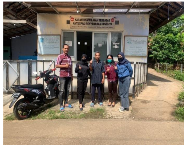
Gambar 6. Foto Bersama di depan kantor RW 017

Tahap ini adalah kegiatan dalam pelatihan dan seminar mengenai program yang sudah dibuatkan agar dapat dipahami oleh pengurus dalam menjalankan Sistem Informasi Akuntansi Pengelolaan Dana Kas pada RW 017 Bekasi Timur Regensi tersebut.