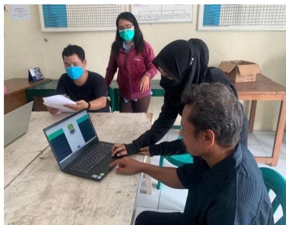
Gambar 3. Pelatihan Kepada Pengguna / User

Tahap ini dilakukan dengan observasi ke RW 017 Bekasi Timur Regensi serta melakukan wawancara terkait permasalahan yang akan dikaji untuk memulainya program pengabdian masyarakat.