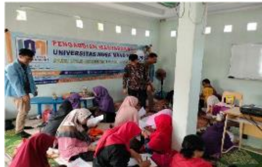
Gambar 1. Pelaksanaan Kegiatan

Tahap ini merupakan tahap realisasi yaitu pelaksanaan pengabdian kepada masyarakat dengan memberikan pelatihan sebagai solusi dari permasalahan yang ada pada Gambar 1.