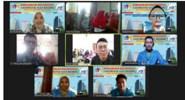
Gambar 6. Foto Bersama setelah kegiatan

Kegiatan pengabdian kepada masyarakat berjalan dengan sangat baik dan lancar. Peserta sangat antusias serta mendapatkan tanggapan yang positif. Pada sesi akhir, dilakukan foto bersama seperti yang terlihat pada gambar 6.