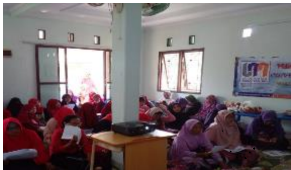
Gambar 4. Peserta para pelajar Yayasan SIGMA

Gambar 4 adalah peserta pelatihan dengan tema Pelatihan Pengelolaan SDM di Era Digital pada Koperasi Serba Usaha Komunitas Warga Bojong Gede (KSU KOWAGE), Bogor berjumlah 20 orang