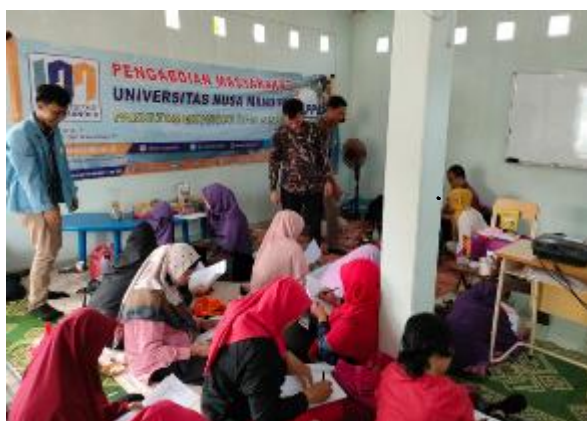
Gambar 5. . Sesi tanya jawab

Kemudian tutor membahas lebih dalam tentang Pengelolaan SDM di Era Digital seperti proses Manajemen Sumber Daya Manusia (MSDM), keuntungan transformasi digital MSDM dan tantangan yang dihadapi, Tips dan trik melakukan pengembangan kualitas SDM dalam era digital. Selama kegiatan peserta diberi kesempatan untuk bertanya atau diskusi dengan memberikan instruksi terlebih dahulu seperti terlihat pada gambar 5.