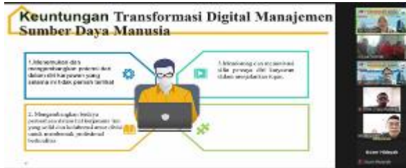
Gambar 3. Penyampaian Materi Lanjutan

Gambar 3 menunjukkan penyampaian materi lanjutan kegiatan yaitu dengan memperkenalkan materi tentang Pengelolaan SDM di Era Digital.