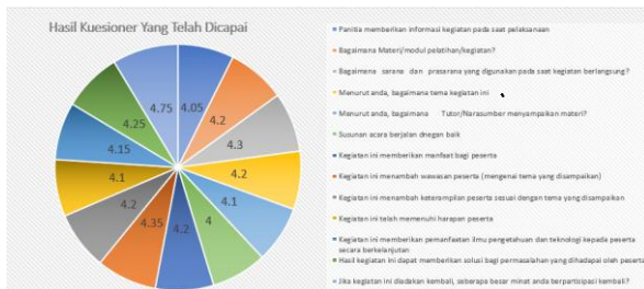
Gambar 7. Grafik Hasil Kuesioner Yang Telah Dicapai

Hasil kuesioner yang telah dicapai juga dapat dilihat pada gambar grafik berikut: