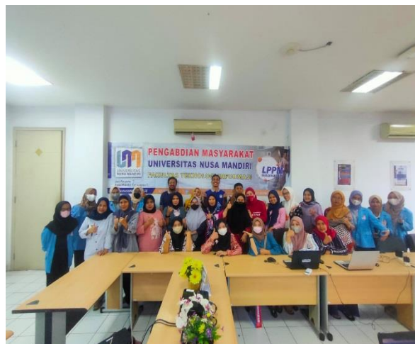
Gambar 5. Foto bersama peserta dan panitia PM

Pada gambar 4 menjelaskan pelaksanaan kegiatan pengabdian dilakukan dengan cara praktek langsung penggunaan website oleh para peserta yang di bantu oleh para tutor.