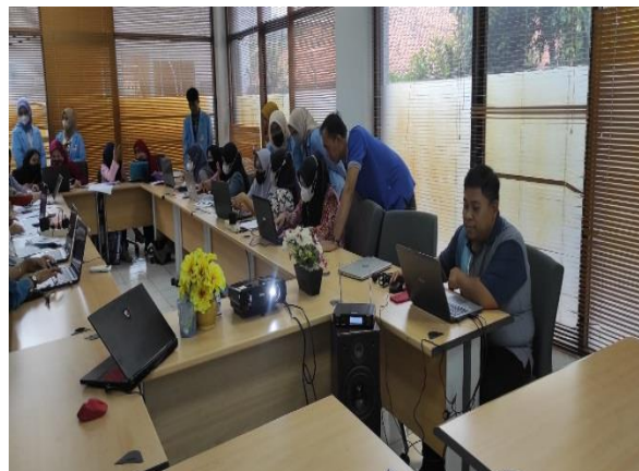
Gambar 4. Pelaksanaan Pengabdian masyarakat

Hari : Sabtu Tanggal : 1 April 2023 Waktu : 13.00 WIB - Selesai Tempat : UNM Kampus Damai. Jl. Damai No. 8, Warung Jati Barat