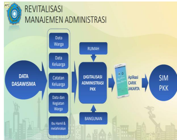
Gambar 2. Pendataan yang dilakukan Dasawisma

Dasawisma mendata beberapa data keluarga seperti data warga, data keluarga, catatan keluarga, data dan kegiatan warga, sampai dengan mendata ibu hamil dan melahirkan. Seperti dalam gambar 2 berikut [5].