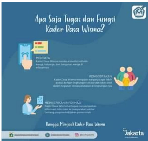
Gambar 1. Tugas dan Fungsi Dasawisma

Setiap pelaksanaan kegiatan organisasi tentu tidak lepas dari kegiatan administrasi yang menghasilkan arsip, karena arsip pada dasarnya merupakan sumber informasi dari setiap kegiatan yang dilakukan [4]