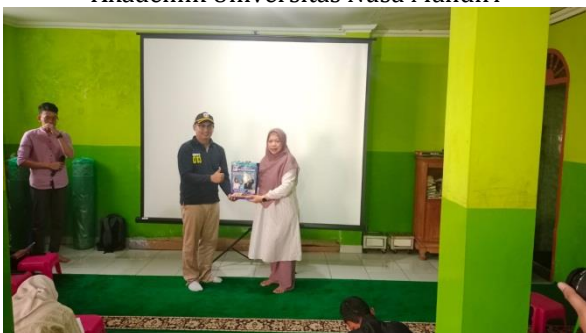
Gambar 8. Pemberian Souvenir Kepada Peserta Mitra