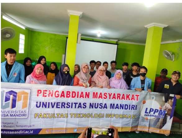
Gambar 9. Bersama Peserta PkM, Dosen, dan Mahasiswa

Dengan adanya kegiatan pengabdian masyarakat ini dalam bentuk pelatihan design UI/UX dalam membangun sebuah website dapat menambah pengetahuan peserta agar dapat membuat website yang menarik serta dapat meningkatkan mutu kualitas pengurus RW. 013.