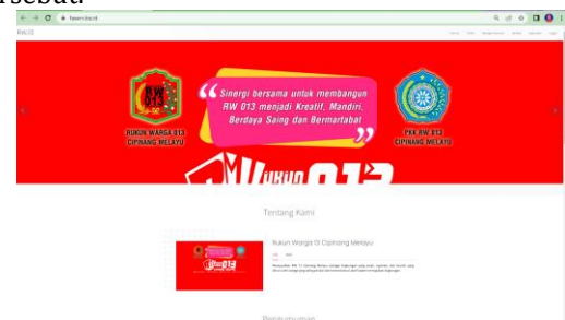
Gambar 4. Website RW. 013 Cipinang Melayu

Pelaksanaan kegiatan pengabdian masyarakat ini dilakukan dengan metode ceramah, diskusi dan pelatihan membuat website. Peserta kegiatan diberikan pemaparan materi yang disampaikan oleh tutor dengan membahas menu-menu pada website yang telah dibuat dan tata cara maupun prosedur dari penggunaan website tersebut.