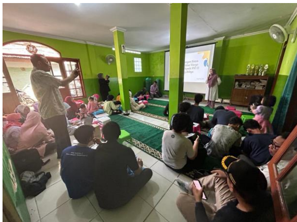
Gambar 7. Sambutan dari Wakil Rektor I Bidang Akademik Universitas Nusa Mandiri