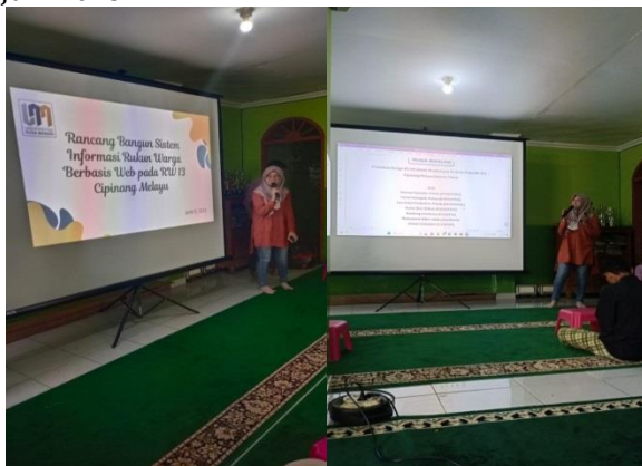
Gambar 1. Pemaparan Materi

Kegiatan pengabdian masyarakat ini dilaksanakan di Jalan Jatiwaringin Raya RW.13 Kel. Cipinang Melayu, Kec. Makasar Jakarta Timur. Tujuan pelaksanaan kegiatan ini adalah untuk meningkatkan kemampuan peserta dalam mendesain sebuah aplikasi website dan dengan kegiatan ini diharapkan dapat belajar bagaimana melakukan User Research , sehingga akhirnya mendesain aplikasi Website dengan interaktif. Setelah mengikuti kegiatan ini, peserta mampu menentukan user interface /tampilan sebuah website. Sementara desainer UX bertugas menentukan bagaimana website tersebut beroperasi. Keduanya sama-sama bertugas untuk membuat user interface. Bagaimana semua elemen saling berhubungan dan menciptakan user interface yang efektif untuk digunakan. Peserta kegiatan ini dihadiri oleh pengurus dari RW. 013 Cipinang Melayu Jakarta Timur dengan jumlah peserta sebanyak 20 orang. Berikut dokumentasi kegiatan yang telah dilakukan pada hari Minggu, 11 Juni 2023.