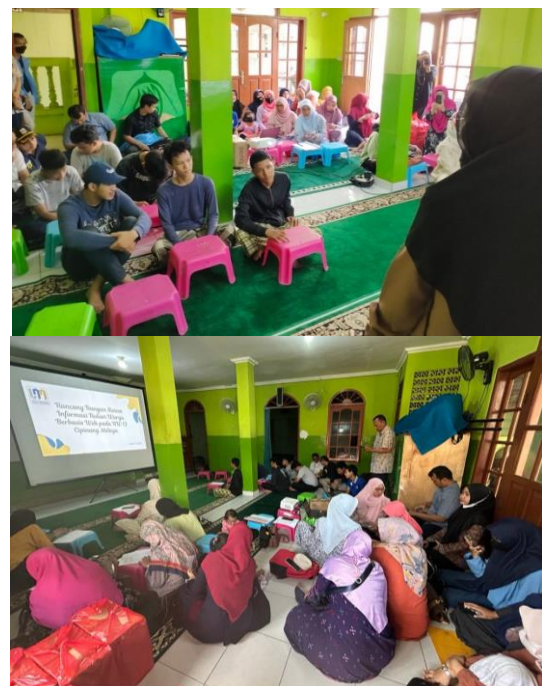
Gambar 3. Proses Pendampingan Peserta dalam Pelatihan Design UI/UX dalam Membangun Website

Pelaksanaan kegiatan pengabdian masyarakat ini dilakukan dengan metode ceramah, diskusi dan pelatihan membuat website. Peserta kegiatan diberikan pemaparan materi yang disampaikan oleh tutor dengan membahas menu-menu pada website yang telah dibuat dan tata cara maupun prosedur dari penggunaan website tersebut.