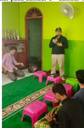
Gambar 6. Sambutan dari Ketua RW. 013 Cipinang Melayu

Kegiatan pelatihan ini diakhiri dengan sambutan dari Ketua RW. 013 Cipinang Melayu, sambutan dari Wakil Rektor I Bidang Akademik, pemberian souvenir kepada mitra dan foto bersama dengan tim tutor dan juga peserta kegiatan. Adapun dokumentasi pada akhir kegiatan dapat dilihat pada Gambar 6 – Gambar 9 .