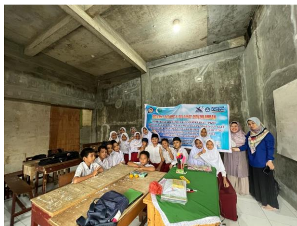
Gambar 3. Foto Bersama Tim Pengabdian dengan Siswa/I MIS Nurul Hidayah Medan

Tahap terakhir adalah tim pengabdian melakukan foto bersama dengan siswa/i kelas V MIS Nurul Hidayah Medan yang dapat dilihat pada Gambar 3.