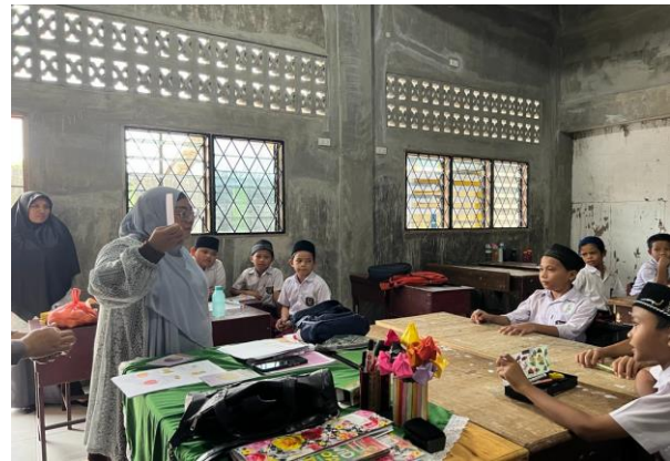
Gambar 2. Tim pengabdian sedang menggunakan alat edukasi kartu bergambar ( flash card ) dalam pelajaran bahasa Inggris

sebelumnya untuk diimplementasikan dalam pelajaran bahasa Inggris.