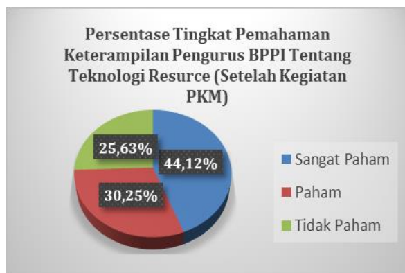
Gambar 8. Grafik Perhitungan Persentase Tingkat Keterampilan Pengurus BPPI Setelah Kegiatan PKM

Gambar 7 menunjukkan persentase tingkat keterampilan dari pengurus BPPI sebelum pelatihan teknologi Informasi resource menunjukkan 44,12% tidak paham dan pengurus yang paham dan sangat paham sebesar 55,88% yang telah memiliki keterampilan mengenai teknologi informasi. Setelah dilakukan pelatihan dan pendampingan implementasi Teknologi Informasi Resource pada BPPI tingkat keterampilan pengurus BPPI seperti pada Gambar 8 yaitu yang paham dan sangat paham menjadi 74,37%, persentase ini menunjukkan adanya peningkatan yang cukup signifikan untuk keterampilan teknologi informasi resource bagi pengurus BPPI.