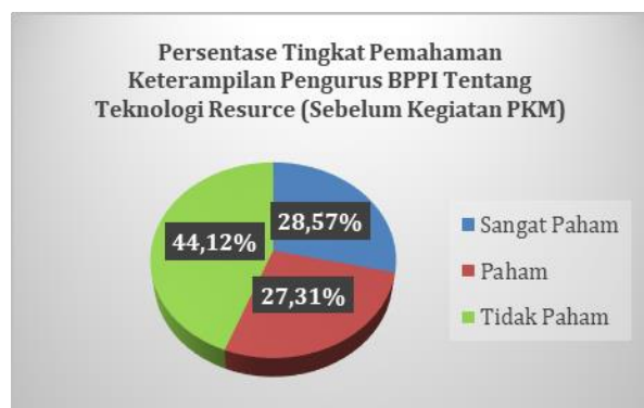
Gambar 7. Grafik Perhitungan Persentase Tingkat Keterampilan Pengurus BPPI Sebelum Kegiatan PKM

Hasil perhitungan peningkatan keterampilan pengurus BPPI berhubungan dengan implementasi teknologi informasi resource sebagai layanan informasi dan manajemen data perkuburan kepada masyarakat berbasis hybrid sebelum kegiatan PKM tersaji pada Gambar 7 dan tingkat keterampilan setelah kegiatan tersaji pada gambar 8.