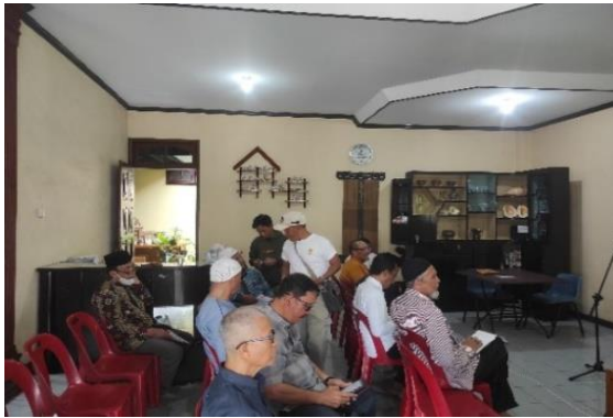
Gambar 3. Pelatihan sosialisasi aplikasi Hybrid BPPI