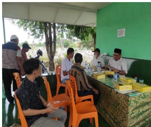
Gambar 1. Koordinasi dan Diskusi dengan Pengurus dan STM BPPI

pelaksana meminta prosedur kegiatan yang dilakukan oleh pengurus perkuburan dalam hasil kegiatan layanan perkuburan dan data-data yang dibutuhkan untuk kegiatan manajemen data perkuburan sebagai bahan untuk perancangan aplikasi berbasis hybrid .