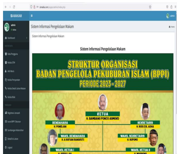
Gambar 9. Tampilan Halaman Admin Aplikasi Pengolahan Data Perkuburan dan Layanan Informasi Kepada Masyarakat

Gambar 9 menampilkan aplikasi berbasis hybrid yang telah dibangun dan digunakan untuk kegiatan operasional pengelolaan manajemen data dan informasi perkuburan dalam meningkatkan layanan kepada masyarakat.