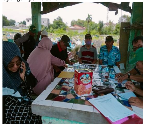
Gambar 2. Wawancara data dengan Pengurus dan Petugas Perkuburan BPPI

Pada gambar 2 tim pelaksana, pengurus dan petugas lapangan BPPI melakukan pertemuan untuk mendapatkan data yang ada di perkuburan berdasarkan informasi yang diberikan oleh petugas lapangan perkuburan