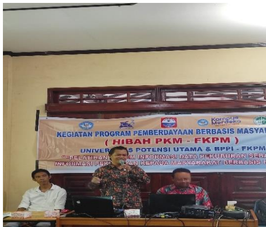
Gambar 4. Pelatihan Implementasi Program Aplikasi Berbasis Hybrid

Hasil perhitungan tingkat pengetahuan pengurus BPPI terkait implementasi teknologi informasi resource sebagai layanan informasi dan manajemen data perkuburan kepada masyarakat berbasis hybrid sebelum kegiatan PKM terlihat pada Gambar 5 dan tingkat pengetahuan setelah kegiatan PKM terlihat pada Gambar 6.