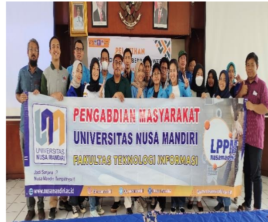
Gambar 6. Peserta dan Panitia PM Melakukan Foto Bersama

di depan peserta dan langsung mempraktekan latihannya yang dibantu oleh para tutor.