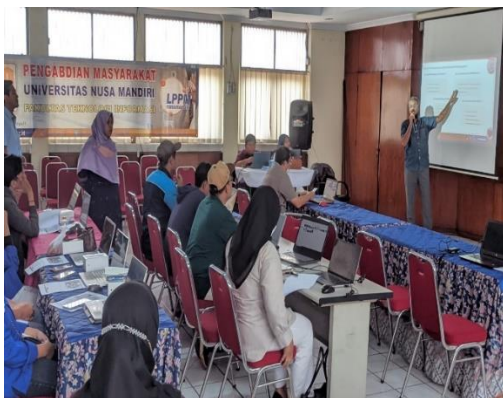
Gambar 5. Pelaksanaan Pengabdian Masyarakat

Pada gambar 5 dapat dilihat bahwa saat pelaksanaan berlangsung tutor menjelaskan materi