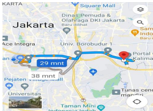
Gambar 4. Lokasi Pengabdian Masyarakat