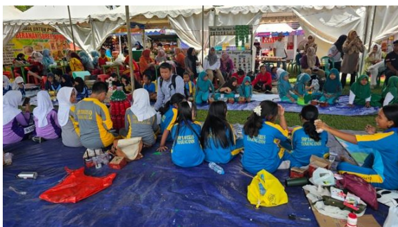
Gambar 4. Festival Pempek di Karang Asam Festival

Hal ini dapat dilihat pada pelaksanaan festival pempek sebagai bagian dari Karang Asam Festival (Gambar 4), yang menampilkan beragam olahan pangan lokal sekaligus menjadi sarana promosi dan edukasi kuliner tradisional kepada masyarakat.