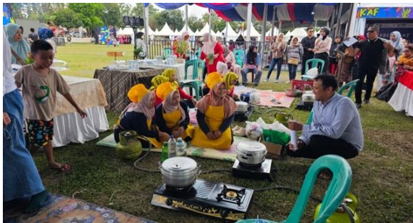
Gambar 1. Kegiatan Lomba di Festival Karang Asam

Pada pendekatan ini yang diterapkan dalam program ini terbukti efektif dalam membangun keterlibatan masyarakat secara bermakna ( meaningful participation ). Keterlibatan ibu PKK, dan panitia festival menunjukkan bahwa edukasi dari gizi tidak diposisikan sebagai intervensi top-down , melainkan sebagai proses dari kolaboratif yang berbasis kebutuhan akan pengetahuan lokal. Hal ini tercermin dari partisipasi aktif masyarakat dalam berbagai kegiatan edukasi dan praktik yang dilaksanakan selama program (Gambar 1 dan Gambar 2).