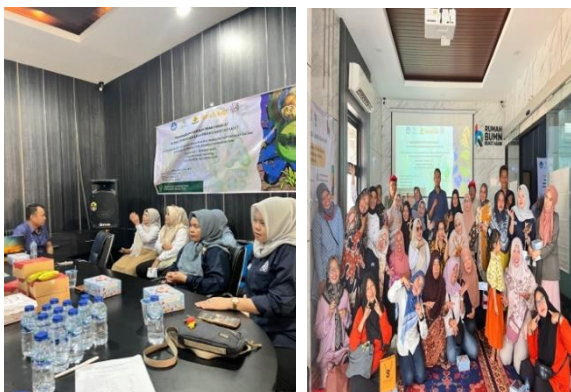
Gambar 2. Implementasi Kegiatan Pengabdian Kepada Masyarakat

Evaluasi efektivitas program juga didukung oleh hasil pre-test dan post-test yang menunjukkan adanya perubahan pada tingkat pemahaman peserta (Gambar 3).