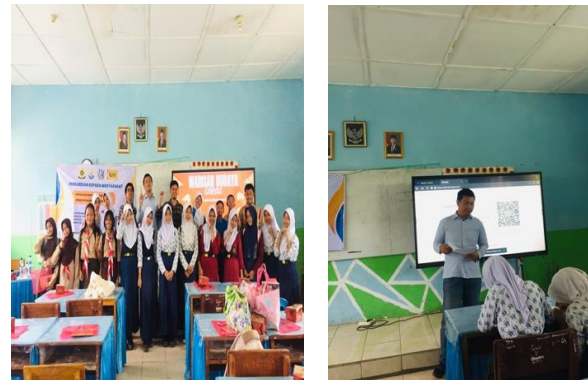
Gambar 5. Implementasi Dari Kegiatan Festival Pempek

Lebih lanjut, implementasi kegiatan festival pempek menunjukkan keterlibatan aktif pelajar dalam proses pengolahan dan penyajian produk pangan lokal (Gambar 5).