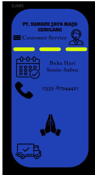
Gambar 8. Halaman Layanan Customer Service

Pengguna dapat menghubungi kontak layanan kantor yang tersedia pada halaman terakhir, serta jenis layanan yang ingin ditanyakan. Prototype halaman layanan customer service dapat dilihat pada Gambar 8.