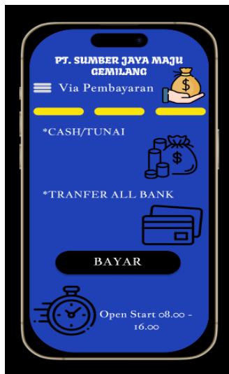
Gambar 7. Halaman Metode Pembayaran