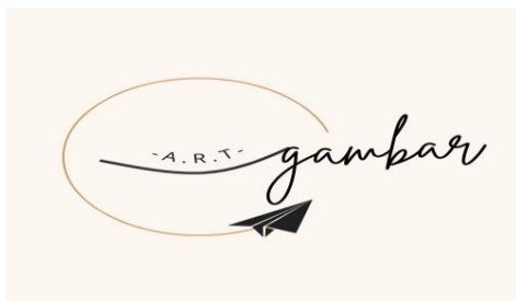
Gambar 1. Logo GambArt

Tahapan prototype dalam pendekatan design thinking adalah tahapan di mana peneliti membuat model atau prototipe dari solusi yang telah dihasilkan pada tahapan ideate. Dalam penelitian jurnal yang membahas tentang meningkatkan potensi usaha UMKM Gambart melalui media sosial dengan pendekatan design thinking, tahapan prototype digunakan untuk membuat prototipe dari solusi yang telah dihasilkan pada tahapan ideate.