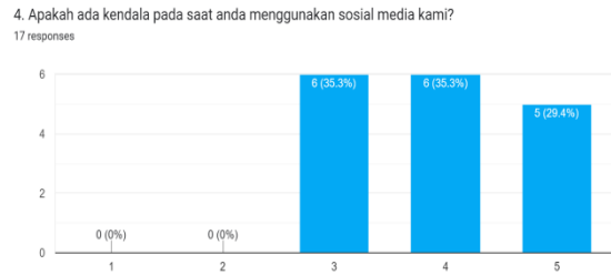
Gambar 5. Diagram Responden Yang Memiliki Kendala Saat Menggunakan Sosial Media Kami

Pada diagram diatas responden yang merasa terbantu dengan media sosial dalam mendapatkan produk kami yaitu 8 responden atau 47,1%, disusul 5 responden atau 29,4% dan 5 responden atau 29,4%.