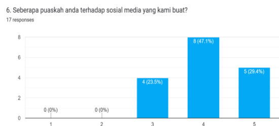
Gambar 7. Diagram Kepuasan Terhadap Media Sosial Kami

Data diatas menunjukkan bahwa yang paling banyak memberikan tanggapan terhadap pelayanan kami yaitu 10 responden atau 58,8%, disusul 5 responden atau 29,4%, lalu 2 responden atau 11,8%.