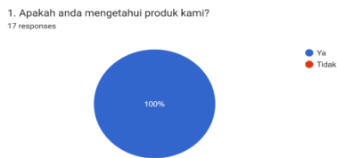
Gambar 2. Diagram Responden Yang Mengenal Produk Kami

Dari jumlah keseluruhan responden, Mahasiswa yang merupakan paling banyak menginstall aplikasi ini yaitu 6 responden atau 35,3%, sisanya yaitu Karyawan 5 responden atau 29,4%, Guru 2 responden atau 11,8%, Ibu Rumah Tangga 2 responden atau 11,8%, lalu Pelajar 1 responden atau 5,9%.