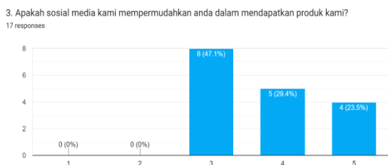
Gambar 4. Diagram Sosial Media Dalam Memudahkan Mendapatkan Produk

Dari hasil pengumpulan data, bahwa 58,8% responden mengenai melalui kenalan kerabat, lalu 29,4% responden mengenal melalui aplikasi instagram, sisanya 11,8% responden mengenal produk kami melalui aplikasi tiktok.