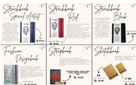
Gambar 2. Mock up Desain Sosial Media GambArt

Filosofi warna krem pada logo diatas melambangkan unsur kehangatan dan perasaan yang nyaman. Bentuk bulat dapat menyampaikan pesan positif dengan sangat baik dari si pemilik logo, bersifat stabil dan seimbang.