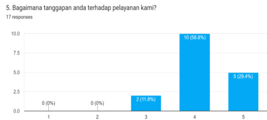
Gambar 6. Diagram Tanggapan Terhadap Pelayanan Kami

Berdasarkan data tersebut, sebanyak 6 responden atau 35,3% , 6 responden atau 35,3% dan 5 responden atau 29,4% yang memiliki kendala saat menggunakan sosial media kami.