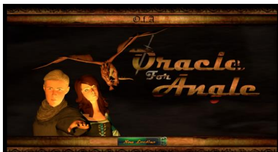
Sumber: (Mustofa, 2017)

Hasil dari realisasi video game adalah sebagai berikut: