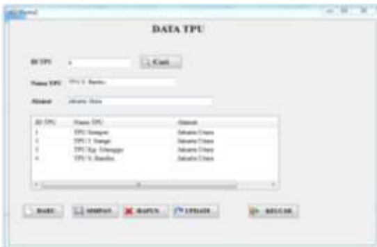
Gambar 5. Form Data TPU

Gambar diatas dinamakan form hasil perhitungan akhir metode AHP berfungsi untuk menghitung hasil akhir dari pengelolaan kuesioner berdasarkan beberapa kriteria dan beberapa alternatif.