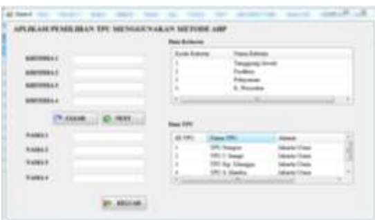
Gambar 6. Form Kriteria

Gambar 5. Form data TPU berfungsi untuk memilih TPU mana saja yang akan dijadikan bahan untuk penelitian di wilayah jakarta utara.