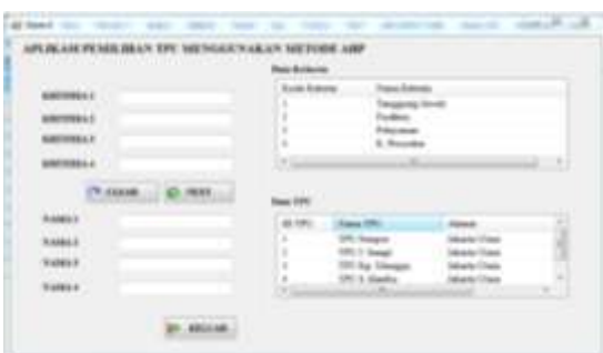
Gambar 6. Form Kriteria

Gambar 5. Form data TPU berfungsi untuk memilih TPU mana saja yang akan dijadikan bahan untuk penelitian di wilayah jakarta utara.