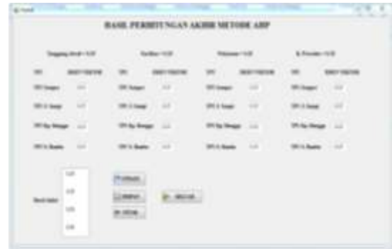
Gambar 7. Form Hasil Perhitungan Akhir Metode AHP

Pengelolaan pada form bobot kriteria dengan cara menginput beberapa kriteria yang digunakan penulis didalam penelitian yaitu tanggung jawab, fasilitas, pelayanan, kesediaan prosedur.