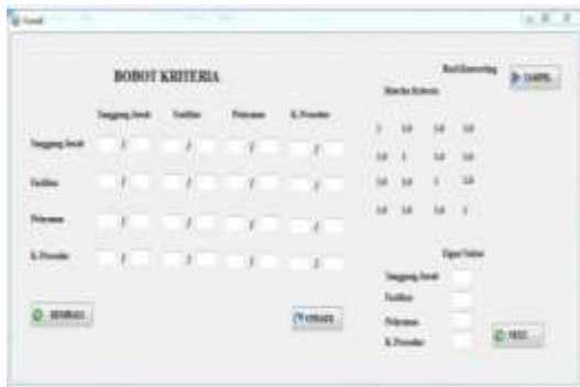
Gambar 4. Form Bobot Kriteria

Pengelolaan pada form bobot kriteria dengan cara menginput beberapa kriteria yang digunakan penulis didalam penelitian yaitu tanggung jawab, fasilitas, pelayanan, kesediaan prosedur.