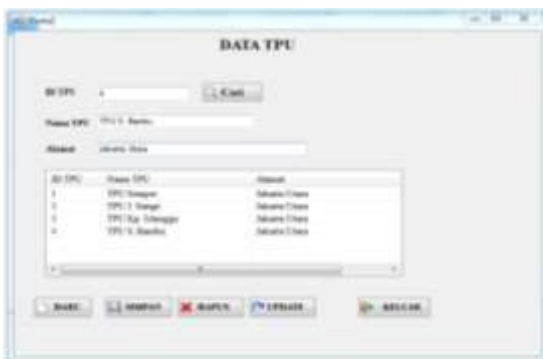
Gambar 5. Form Data TPU

Gambar diatas dinamakan form hasil perhitungan akhir metode AHP berfungsi untuk menghitung hasil akhir dari pengelolaan kuesioner berdasarkan beberapa kriteria dan beberapa alternatif.