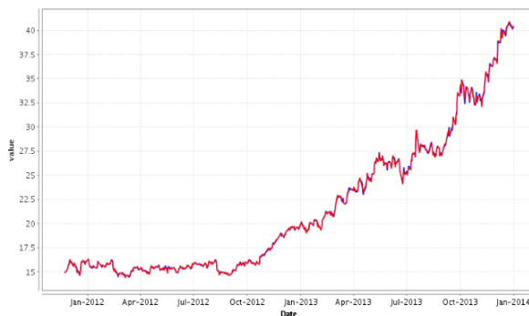
Gambar 4. Hasil Data Testing SVMPSO

Dari hasil eksperimen diatas terlihat bahwa PSO dapat meningkatkan nilai akurasi. Terlihat bahwa sebelum menggunakan PSO memberikan nilai akurasi sebesar 94.8% untuk training dan 94.6% untuk testing , setelah PSO di gunakan maka terjadi peningkatan dengan nilai akurasi sebesar 95.3% untuk training dan 95.4% untuk testing .