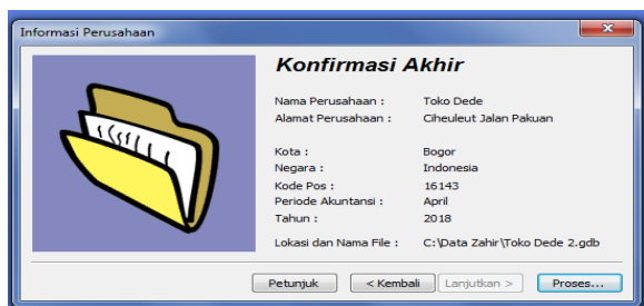
Gambar 1. Setup Perusahaan

perusahaan maka tidak akan bisa dirubah lagi periode transaksi yang sudah dilakukan.