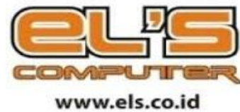
Gambar 6. logo els.co.id