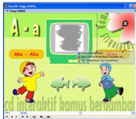
Gambar 4. Desain Interface Menu Latihan

Di dalam menu belajar huruf A, akan di tampilkan kosakata bahasa inggris yang di susun berdasarkan abjad dalam bahasa Indonesia dengan awalan huruf A.